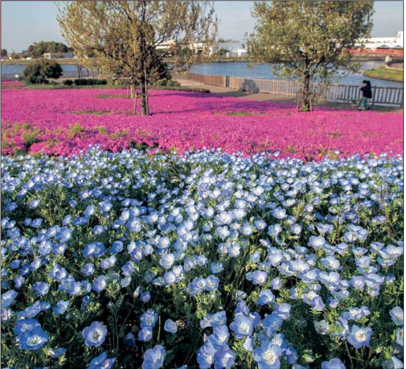
三ツ又池公園 芝桜とネモフィラ (弥富市)